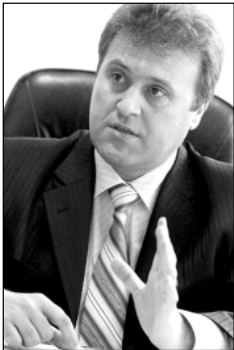
Нихат КАБИЛ Министър на земеделието и горите

– Няма да е правилно да се каже дали е виновен този или онзи. Ако говорим за вина, тя е във всички ни. Защото при подписан договор и поети ангажименти не може да има компромис. Когато си притиснат от времето и имаш срокове, които вече се скъсяват, трябва да реагираш като в шаха в цайтнот – решението трябва да е много бързо и много правилно, добре обмислено и с визия за доста години напред. В създадената ситуация аз не съм просто страничен наблюдател. Доста вътре в нещата съм и съзнавам своята отговорност. И на въпроси дали бих си подал оставката, ако България бъде отложена с една година за членство в ЕС, винаги съм казал – ако се докаже, че